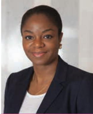
Madam Cina Lawson Minister of Post & Digital Economy of Togo

Cina Lawson is Minister of Post and Digital Economy of Togo, building on years of experience in the areas of telecommunications. Previously, as Manager of Corporate Strategy and Business Development at the Orange Group in New York City. Prior to that, she worked at Alcatel-Lucent in Paris. Lawson began her career at the World Bank in Washington, DC where she worked on telecom restructuring projects in developing countries focusing on regulatory reforms. She is a graduate of Harvard University's Kennedy School of Government and the Institut d'Etudes Politiques de Paris (Sciences Po). In 2012, Forbes magazine ranked her among the 20 most powerful young women in Africa.