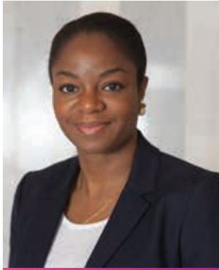
Madam Cina Lawson Ministre des Postes et de l'Économie numérique de la République Togolaise

Cina Lawson est Ministre togolaise des Postes et de l'Économie Numérique au sein du gouvernement de la République togolaise. Elle était Ministre des Postes et des Télécommunications au sein du même gouvernement en 2010. Elle était Directrice de la Stratégie d'entreprise et du développement commercial chez Groupe Orange à New York City. Elle a travaillé chez Alcatel-Lucent à Paris. Elle a débuté sa carrière à la Banque mondiale, où elle conseillait les gouvernements sur les politiques télécoms, les réformes réglementaires et les privatisations. Cina Lawson est diplômée de Kennedy School of Government de l'Université Harvard et de l'Institut d'Études politiques de Paris (section économique et finances). En mars 2012, elle est classée parmi les « 20 jeunes femmes les plus influentes en Afrique » selon le magazine Forbes.